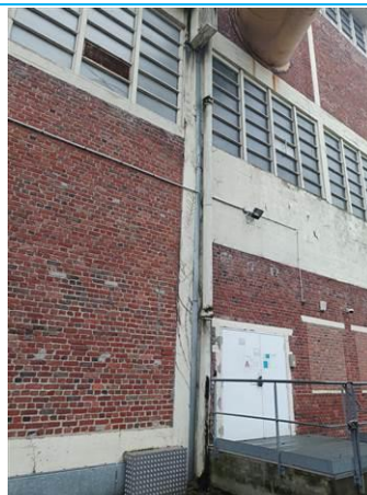
Matériaux : ZPSO-002