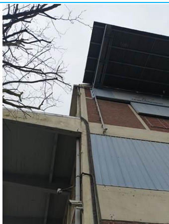
Matériaux : ZPSO-003