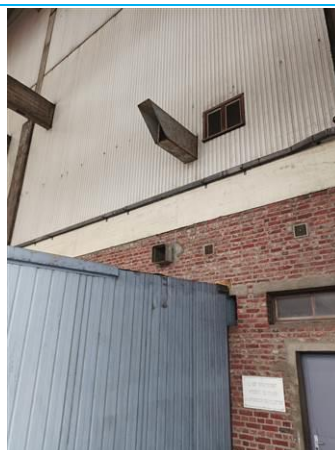
Matériaux : ZPSO-004