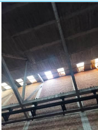
Matériaux : ZPSO-001